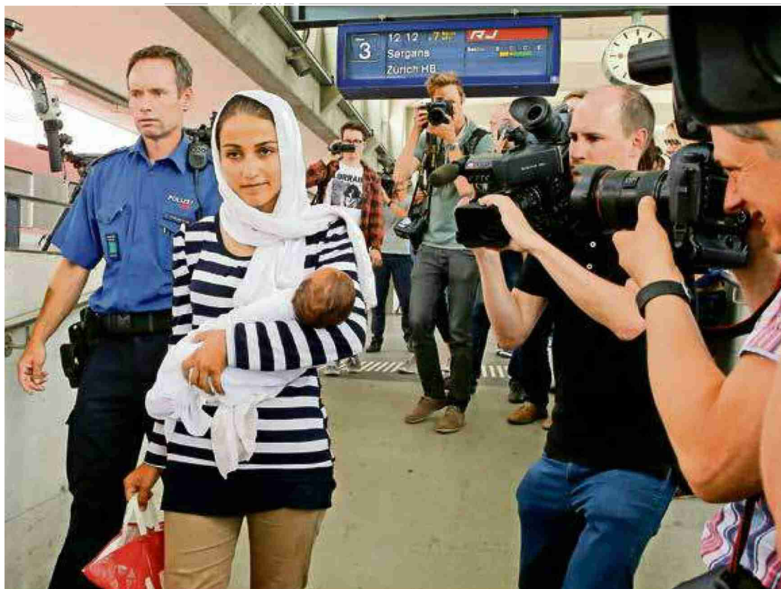
Arrivée de migrants syriens à Buchs (SG), le 1er septembre 2015. L'afflux migratoire vers l'Europe, qui a touché la Suisse de façon marginale, a largement pesé sur les élections fédérales.

ANALYSE Il faudra quelque temps avant de pouvoir faire une analyse approfondie des résultats des élections fédérales du 18 octobre 2015. Mais s'il est probable que le thème de la migration a joué un rôle majeur, ce n'est pas forcément dans le sens qu'on croit: le vote de dimanche ne traduit pas uniquement le succès d'un parti très à droite proposant un discours simplificateur et, à terme, dangereux pour la Suisse elle-même. Ce qui est non moins important, c'est que nous avons affaire à l'échec d'une certaine gauche. Echec, car une bonne partie des discours provenant de la gauche ne proposait guère qu'une autre forme de simplification (moralement plus satisfaisante, mais simplification tout de même). Ce faisant, elle n'a